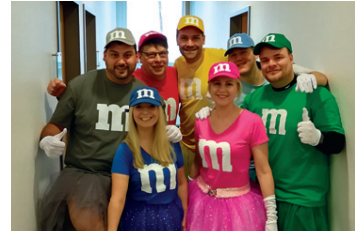
Traditionell findet am Altweiberdonnerstag eine vom Arbeitgeber finanzierte und von Mitarbeiterinnen und Mitarbeitern geplante Karnevalsfeier statt.