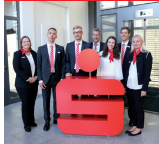
Jedes Jahr startet im Spätsommer ein neuer Auszubildendenjahrgang.