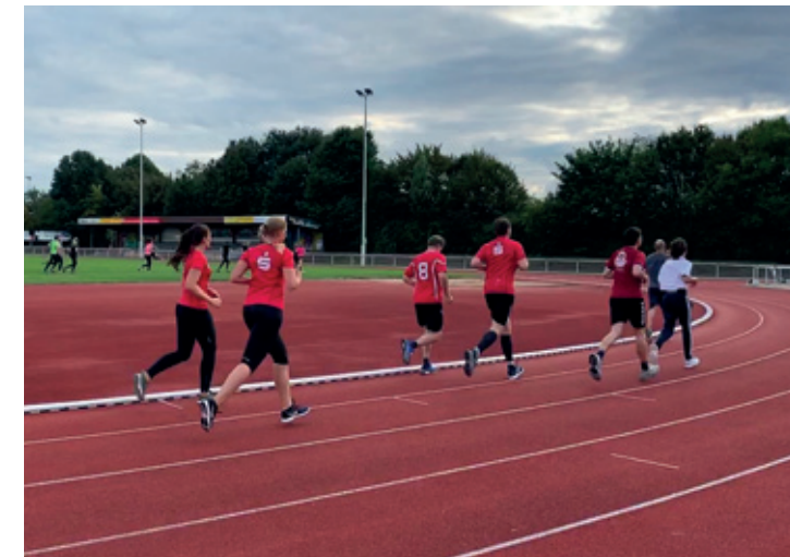
Inzwischen haben einige von uns gemeinsam das Sportabzeichen absolviert.